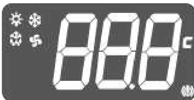
Fig. 2: Display