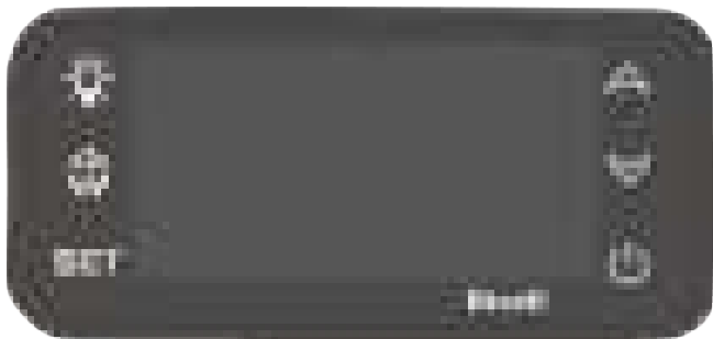
Fig. 1: Operating elements

Operating elements and display screens are located upper left of the goods interior.