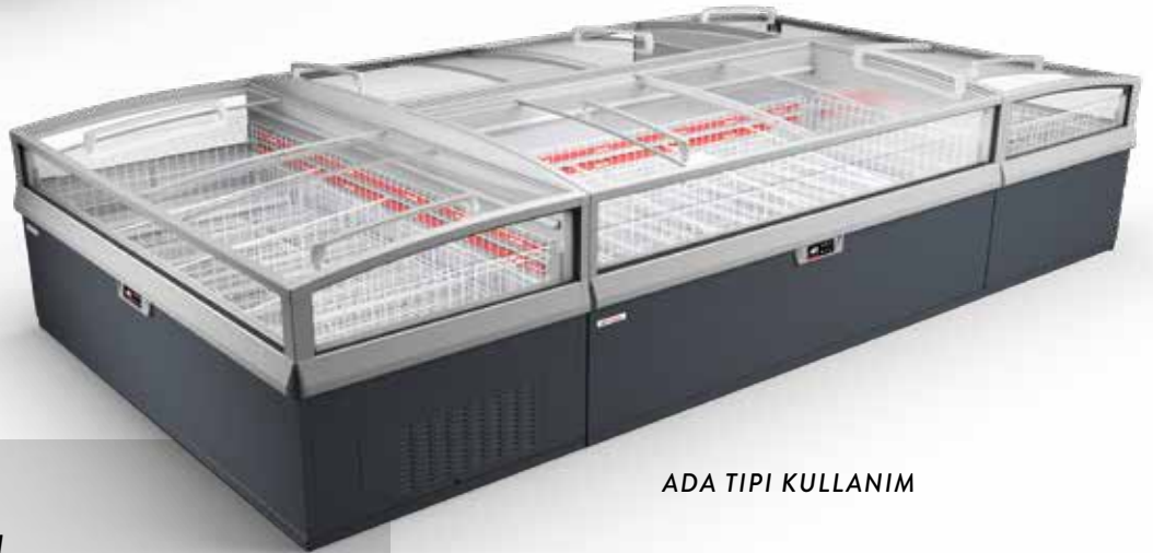
ADA TIPI KULLANIM